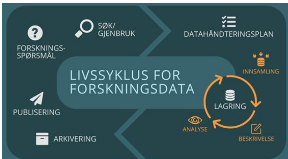
FIGUR 3: LIVSSYKLUS FOR FORSKNINGSDATA. CC-BY NTNU

Forskning organiseres på ulike måter i ulike fagdisipliner og ved ulike institusjoner. Likevel kan det være nyttig å tenke på forskningsarbeidet og forskernes håndtering av data som en syklus med ulike stadier der det må tas ulike hensyn i de ulike fasene, for å sikre god håndtering av forskningsdata. Modellen under illustrerer de ulike fasene av forskningsprosessen fra innledende idé til avsluttet prosjekt.