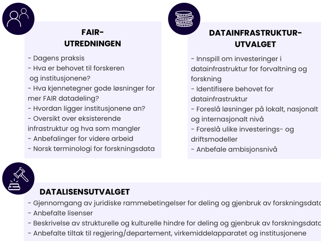
FIGUR 1 TRE DELVIS PARALLELLE FORSKNINGSDATAUTVALG

Utredningen henger nært sammen med to andre arbeider, som vist i Figur 1. Datalisensutvalget leverte 1. oktober 2021 sin sluttrapport. Vårt arbeid baserer seg delvis på diskusjoner, konklusjoner og anbefalinger derfra. Samtidig er også Datainfrastrukturutvalget i regi av Forskningsrådet, i gang med sitt arbeid. Sammenhengen mellom de tre utvalgene er illustrert nedenfor. Vi har tett kontakt med Datainfrastrukturutvalget og utveksler informasjon løpende. Sluttdato for denne utredningen er 15. mars 2022, mens Datainfrastrukturutvalget leverer sin rapport før 1. mai 2022. De kan dermed ta resultatene fra vår utredning med i det avsluttende arbeidet med sin leveranse.